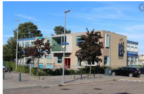
Peutergroep StapYes De Zeeschelpen (Jozefschool) Planciusstraat 34 3151 BT Hoek van Holland