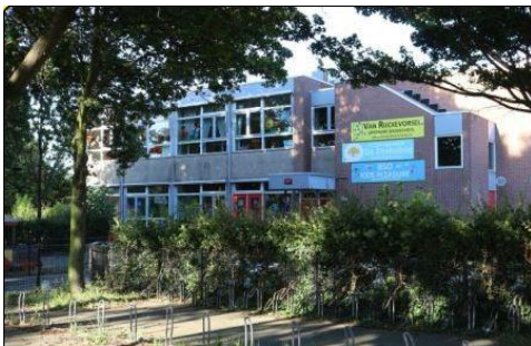
Hoofdlocatie kdv De Zeebaboe (INOVA Basisonderwijs) Tasmanweg 180 3151 CJ Hoek van Holland

Kinderdagverblijf De Zeebaboe heeft twee locaties en meerdere groepen. De locaties van onze kinderopvang zijn gevestigd in twee basisscholen in Hoek van Holland. Hieronder vindt u onze twee locaties;