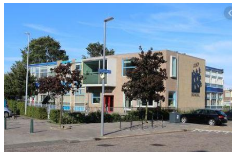
Locatie de Jozefschool Planciusstraat 34 3151BT, Hoek van Holland

*Ten behoeve van de leesbaarheid zal in dit beleidsplan worden gesproken over "ouders", waar gelezen dient te worden "ouders/verzorgers". Met de term "kinderopvang" bedoelen we de opvang in het kinderdagverblijf.